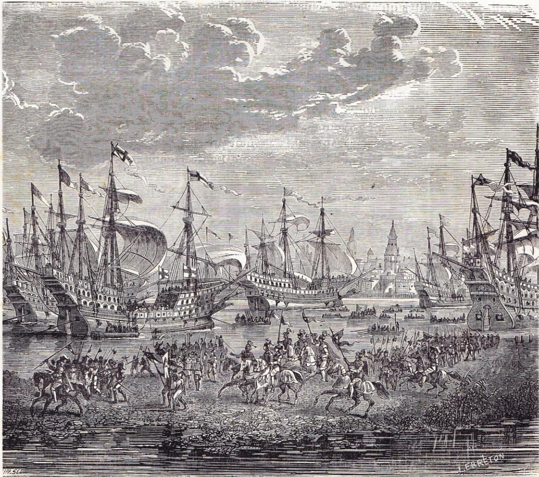
Descente de Henri VIII à Calais pour aller assiéger Boulogne.

voulait jeter sur l'Autriche. Elle détacha même Henri VIII de l'alliance impériale, et le roi d'Angleterre s'effraya si bien de la puissance de Charles-Quint qu'il fit insérer au traité cette clause, assez singulière de la part d'un ennemi, « que la régente ne consentirait à au-