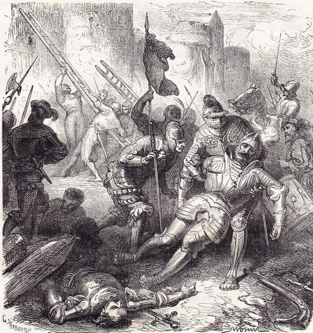
Mort du connétable de Bourbon.

entre Cambrai et Valenciennes, mais que malheureusement il n'osa pas attaquer; car Charles était dans un tel désarroi que de Valenciennes il s'enfuit en Flandre avec cent cavaliers; François se contenta de prendre Hesdin et ramena ses troupes à Amiens.